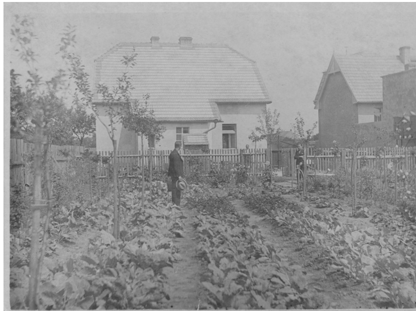
Abb 4a: Grossvaters Haus, 1928