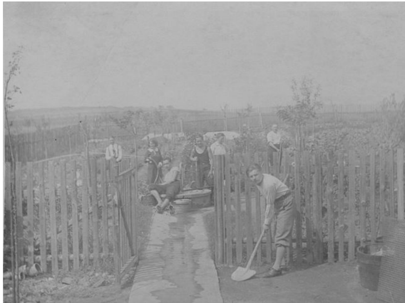
Abb 4b: Grossvaters Obst- und Gemüsegarten