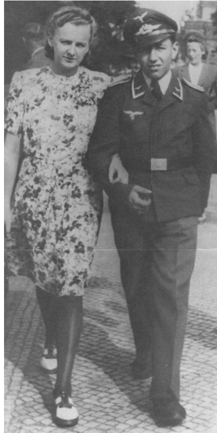
Abb 12: Meine "Tante" und ihr Mann während eines Fronturlaubs, ca 1942