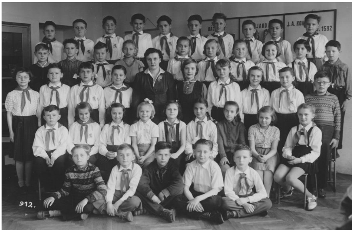
Abb 15: 3. Schulklasse, ich bin in der obersten Reihe, 5. von links, 1958 (diejenigen, die kein Pionierhemd- und Halstuch tragen sind entweder Kinder der Parteileute oder - weniger - Kinder solcher Familien, die sich um gar nichts mehr scherten)