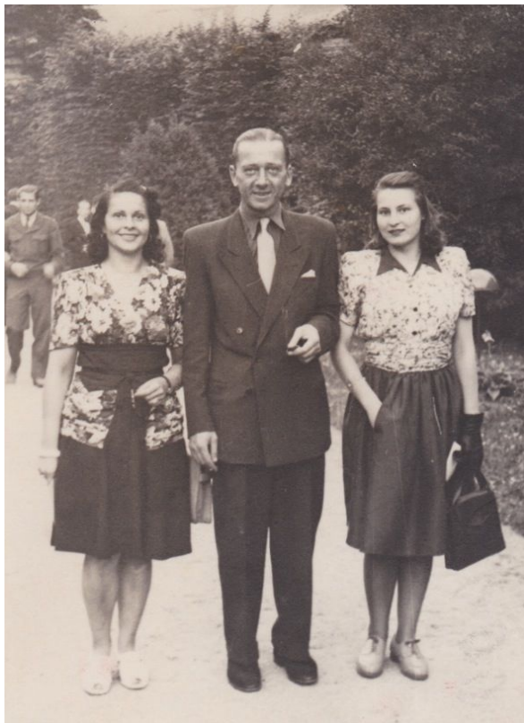
Abb 8a: Meine Mutter rechts