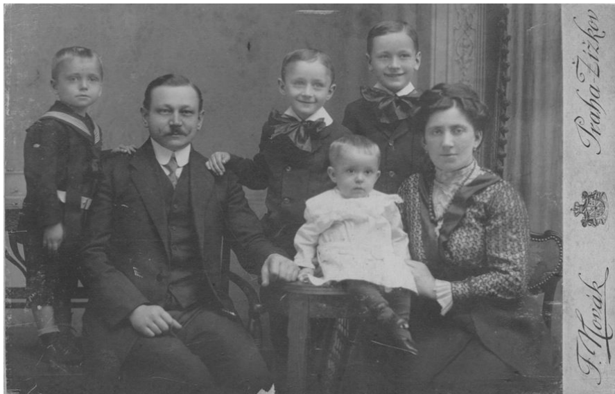
Abb 2: 1914, Prag