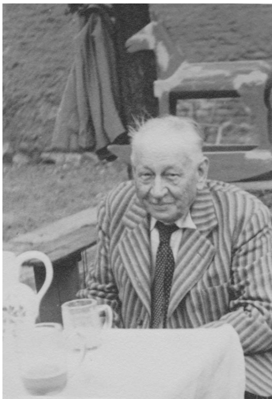
Abb 11: mein Grossvater, das Schaukelpferd für den Enkelsohn