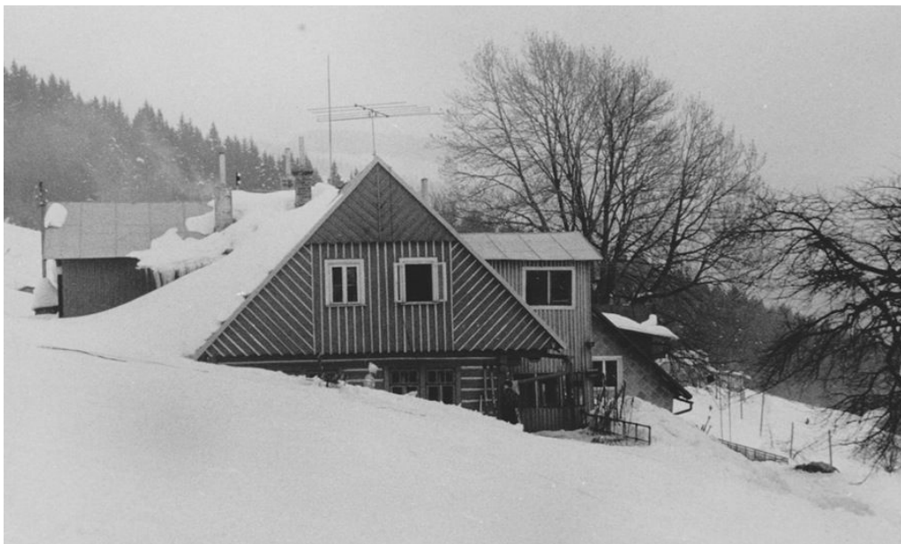
Abb 13: Das Berghaus "Faulenzer", vormals bäuerliches Anwesen